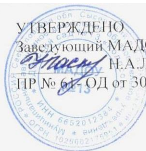
График работы консультативного пункта

УТВЕРЖДЕНО Заведующий МАДОУ № 13 Н.А. Ласкина ПР № 61-ОД от 30.05.2019г.